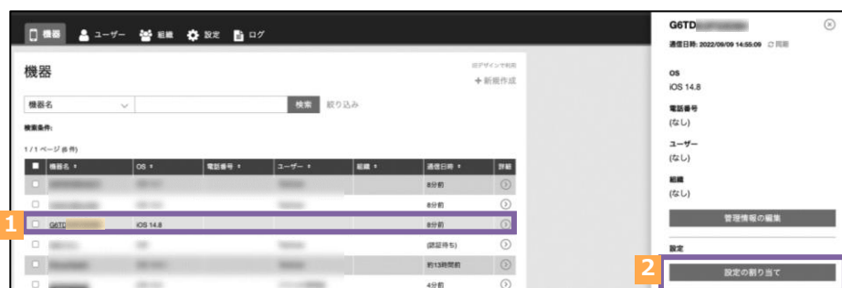
5. 該当iOS端末と作成した「構成プロファイル」を紐づけ